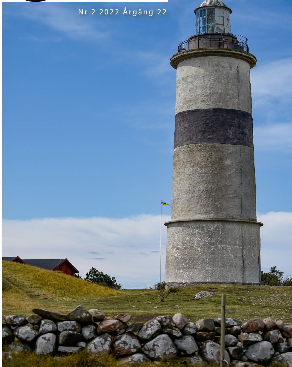
Morups tånge, Halland